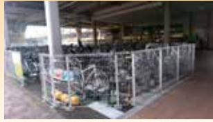
玉川上水駅第2・3駐輪場増設

▶ 広報委員会の委員長として市民に開かれた見やすい解りやすい広報づくりに取り組んでいます。