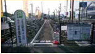
上北台第4公共自転車等駐輪場新設